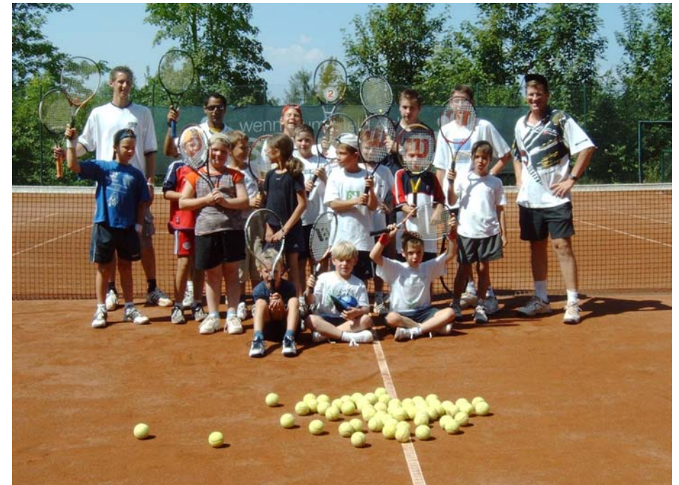
Tenniscamp Sommer 2003